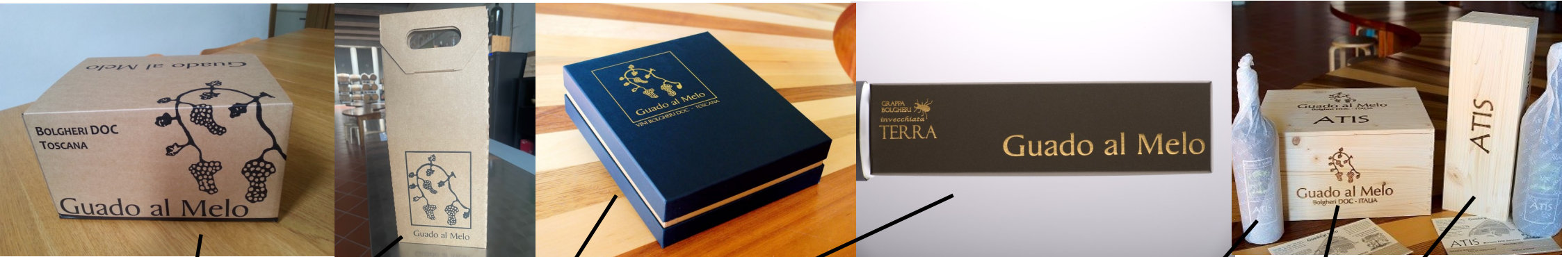
ALCUNI ESEMPI DI NOSTRE CONFEZIONI